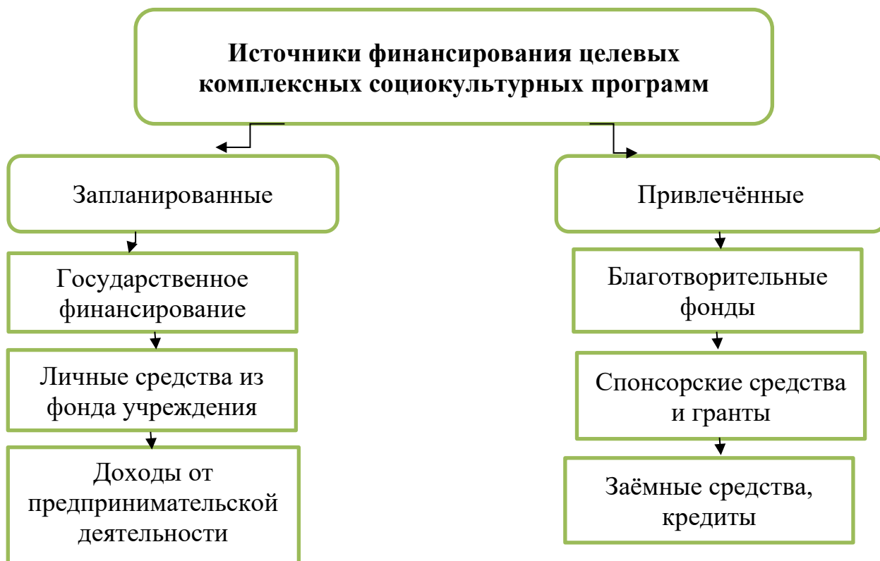
Рис. 1. Финансирование целевых комплексных социокультурных программ

Информация, накопленная в ходе первого этапа, находит выражение в двух основных документах: а) паспорте социокультурного развития; б) матрице анализа социокультурной сферы [2, с. 43].