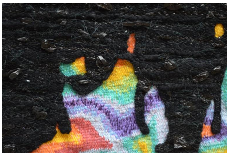
Рис. 1. Гобелен «Прорыв»

Каждый день человек сталкивается с проблемой выбора в последствии ведущей к изменениям, развитию. Философы под развитием обычно понимают нечто необратимое, определено направленное и закономерное изменение материальных и идеальных объектов, приводящее к возникновению нового качества. Оно является одной из фундаментальных основ всего сущего: от Вселенной, которая развивается от хаоса к упорядоченным образованиям, до любой ее пылинки.