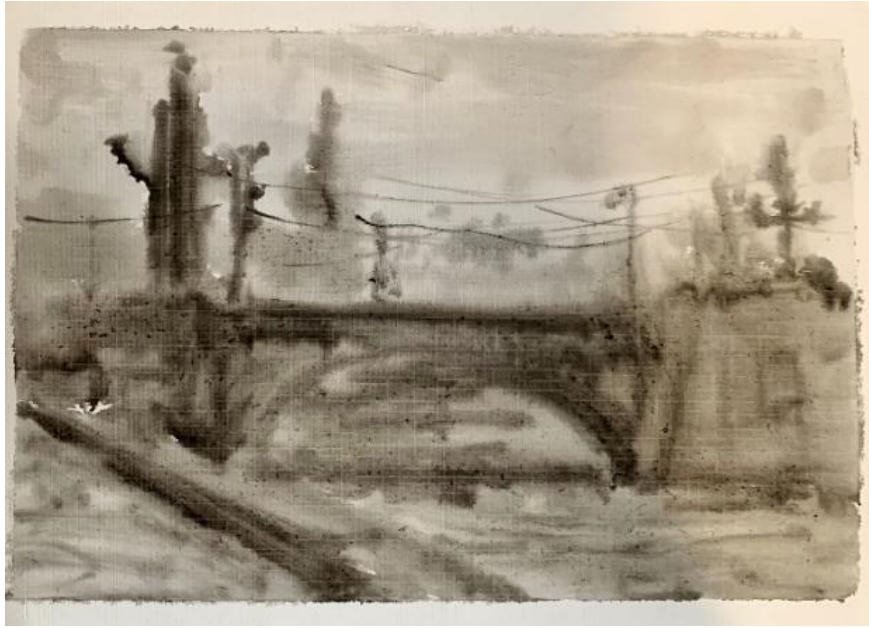
Рис. 1. Серия – чернильная Москва